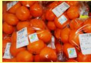
エコファーマー表示のみかん 100g当たりのCO 2 削減量を記載