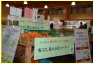
「みはらしの丘あいさい広場」内、 「省CO 2 見える化」コーナー

産直市に「みはらしの丘あいさい広場」で 生産から販売・消費に至るCO 2 排出削減を表示する 「カーボンフットプリント」を実施