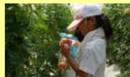
トマトのもぎ取り体験