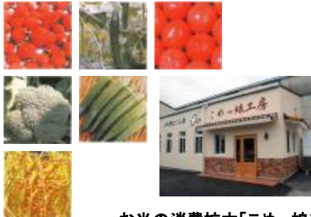
お米の消費拡大「こめっ娘工房」