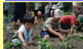
自分で植付から収穫まで体験